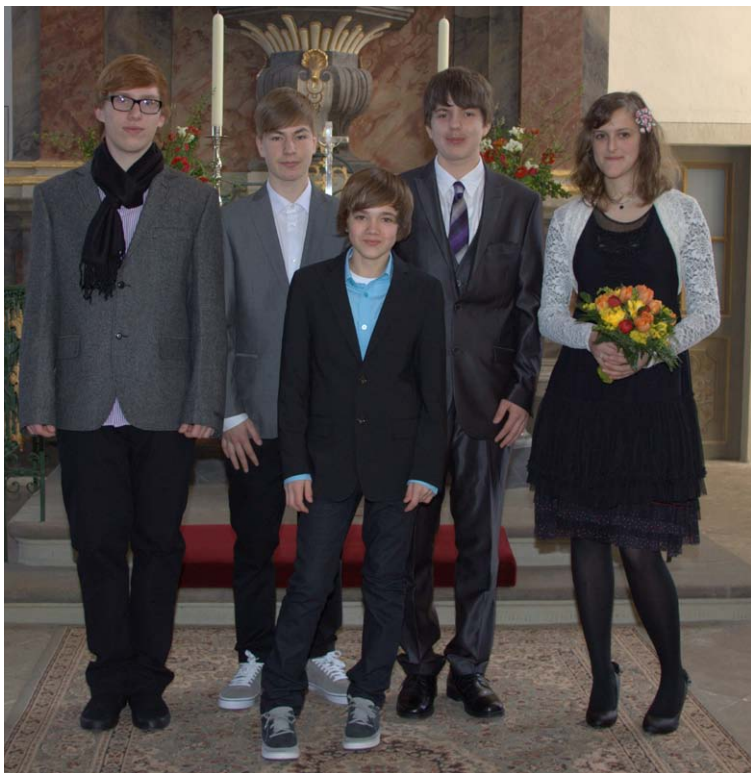
links Nach dem Bild der Naustädter Konfirmanden im letzten Kirchenbrief folgt nun das Konfirmandenfoto aus Röhrsdorf.